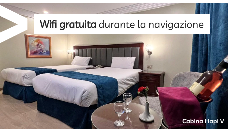
Cabina Hapi V