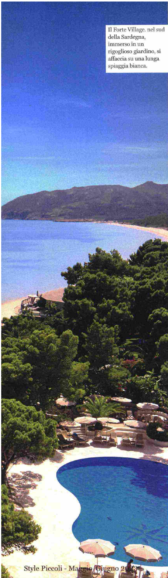
Style Piccoli - Maggio/Giugno 2023

Tuffi in piscina al Resort Le Cesine in Puglia. Qui sopra, il mare della Sardegna da esplorare in canoa al Delphina Valle dell'Erica e con bellissime passeggiate sulla lunga spiaggia di fronte al Chia Laguna.