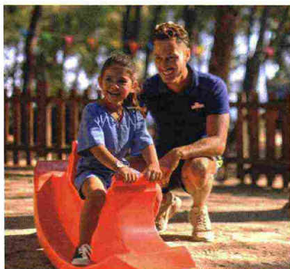
Sono tantissimi gli spazi dedicati al divertimento dei più piccoli tra giochi d'acqua e playground.