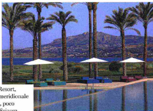
Il Verdura Resort, sulla costa meridionale della Sicilia, poco lontano da Sciacca.

Ritaglio stampa ad uso esclusivo del destinatario, non riproducibile.