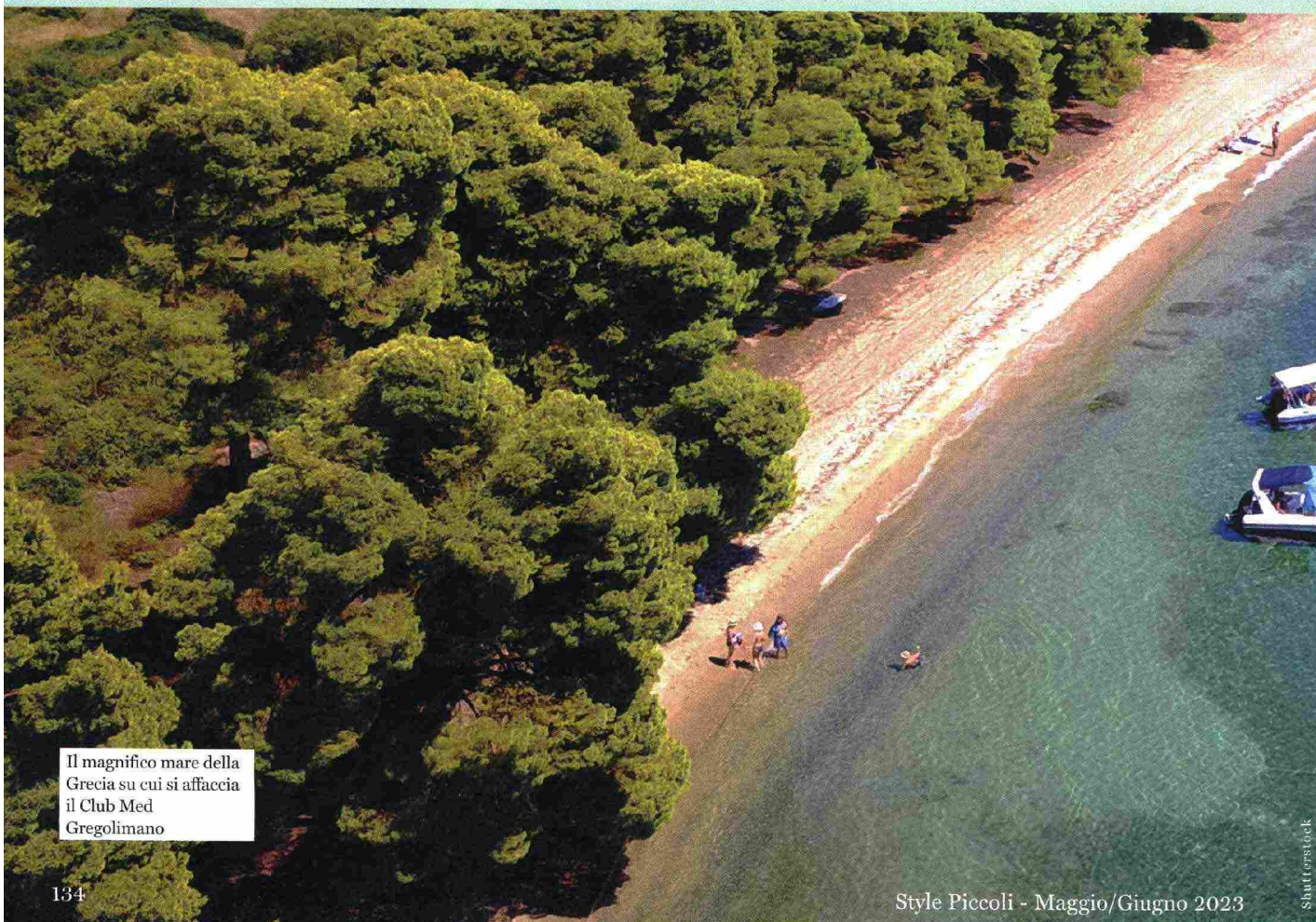
Il magnifico mare della Grecia su cui si affaccia il Club Med Gregolimano

Una vacanza al mare non è solo relax e giochi sotto l'ombrellone. Può diventare l'occasione per riconnettersi con la natura o sperimentare sport e attività nuove. E persino per allenarsi con veri campioni