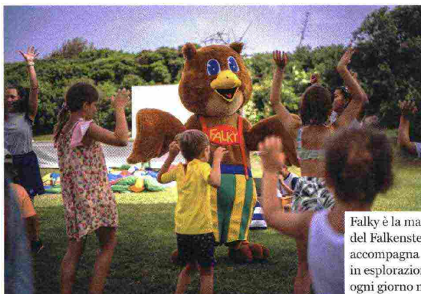
Falky è la mascotte del Falkensteiner, che accompagna i piccoli in esplorazioni e giochi ogni giorno nuovi.

creativi, esplorazioni, osservazioni e atelier di bricolage in cui utilizzano materiali naturali, si avvicinano divertendosi e giocando al tema della tutela ambientale e alla fine delle esperienze vengono insigniti dell'attestato di "ranger". E mentre i bambini e i ragazzi si divertono mamma e papà possono godersi una giornata in spiaggia in tranquillità, rilassarsi a bordo delle piscine a sfioro con vista mare, nella Acquapura Cocoon spa o sperimentare le diverse attività active e sportive proposte dal resort.